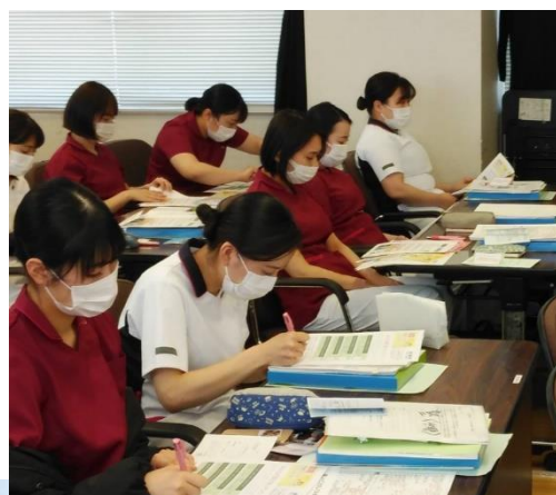
呼びかければアンケート集約は簡単

これまでは5月に個別に行っていた組合説明を、今年は法人に申し入れてオリエンテーションの中で出来ることになりました。執行委員長が組合説明をした後、加入用紙への記入を呼びかけて執行部が回収し、27人中25人が加入しました。共済アンケートでクオカードプレゼントと呼びかけたことが決め手になりました。